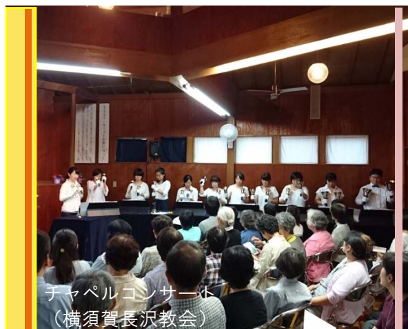
チャペルコンサート (横須賀長沢教会)

2015年度より、前年度の経常献金 700 万円以下のすべての教会が対象となりました。また支援額も広がり、9つの種類で最大 15 万円～60 万円の支援が申請可能です。（詳しくは連盟のHP「規程集」をご覧ください。※閲覧にはパスワードが必要です。）