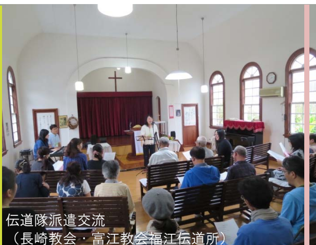
伝道隊派遣交流 (長崎教会・富江教会福江伝道所)

「教会間パートナーシップ伝道」の項目については、相手教会が経常献金 500 万円以下の教会であれば、連盟に加盟するすべての教会が申請し、利用できるようになりました。伝道隊派遣などの際に、ご利用ください。