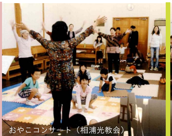
おやコンサート (相浦光教会)

全国諸教会から捧げられる協力伝道献金は、あなたの教会の働きを支えるために用いられます。「これは伝道プログラム支援として申請できるのかな？」と思うようなことでも、ぜひ宣教部にご相談ください！宣教の働きが豊かにされるために、一緒に考えてまいりましょう。