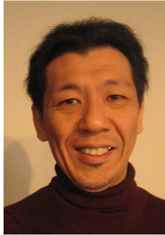
— プロフィール —